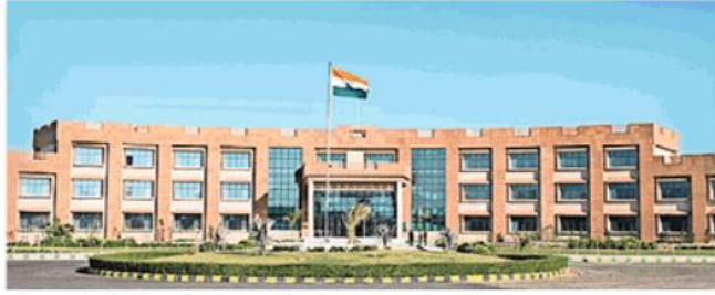
हरियाणा केंद्रीय विश्वविद्यालय •